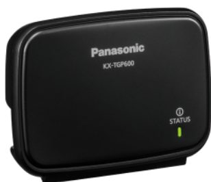
Jednostka bazowa KX-TGP600