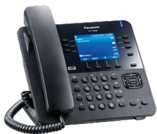
Telefon biurowy KX-TPA68