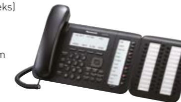
Zdjęcie: KX-NT556 oraz KX-NT505